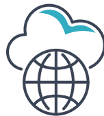
ネットワーク・インフラ・クラウド