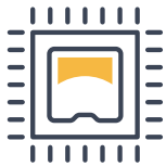
組み込み・デバイスファームウェア

組み込み開発、ネットワーク・インフラ・クラウド構築、アプリケーション開発に加え、システム設計・インテグレーション・運用・保守まですべての領域をフルカバーします。