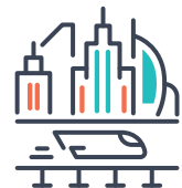
アプリケーション・システム